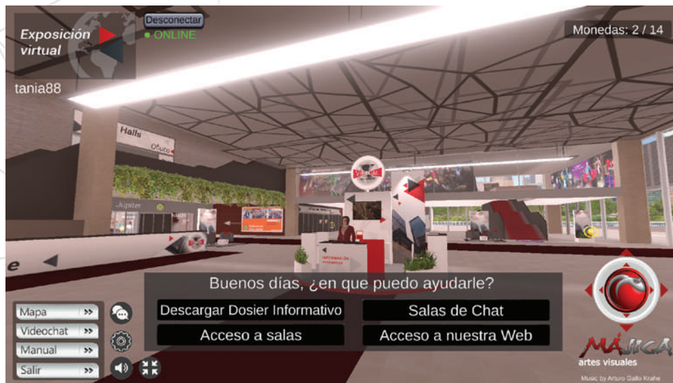
Stand información (Descarga de dossiers, acceso a salas, salas de chat, web)