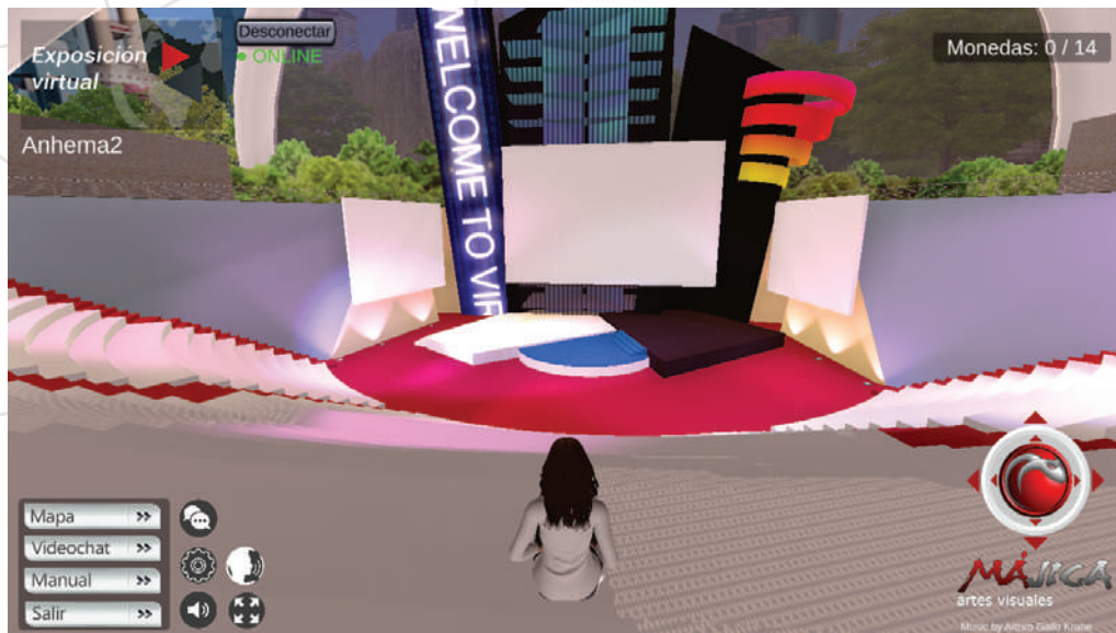
Elección de asiento por plano, según llegada al evento.

Sienta y levanta a tu Avatar, aplaude o vitorea a los ponentes.