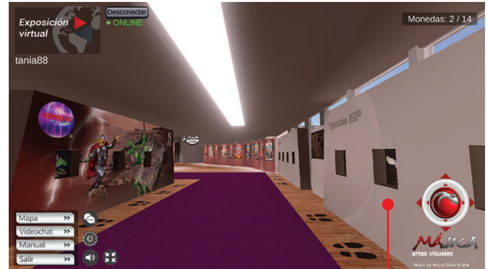
Sala de exposición de producto (visualización de productos en 360° y características)