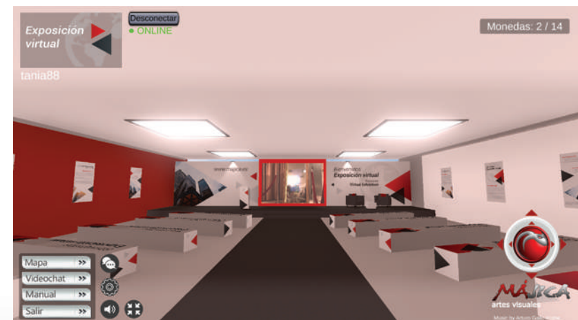
Las Salas de Reuniones tienen infinidad de posibilidades de personalización.