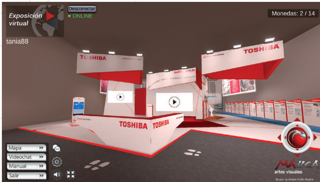
Stands 3D con recorrido 360°, visualización de vídeos, accesos a webs...