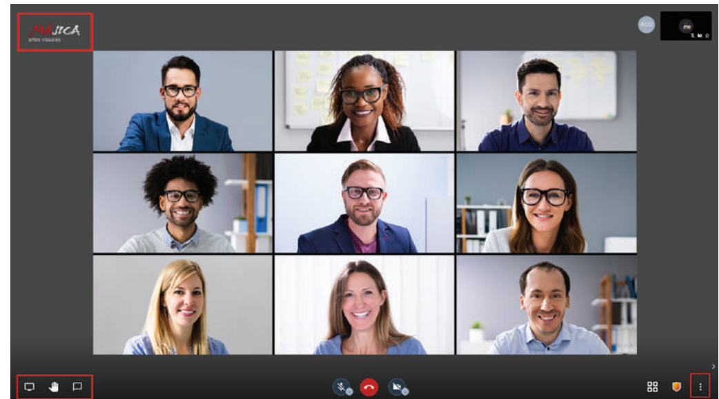
Personalización del Videochat con tu imagen y marca.

4 ▶ También se ofrecen Videoconferencias, donde organizar reuniones privadas o en Streaming, con uno o varios usuarios.